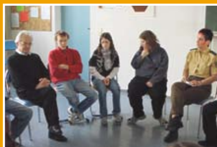
Ein Zeitzeuge berichtet den Schülern aus der Zeit des Nationalsozialismus.