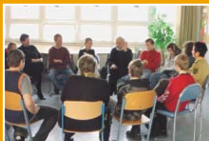
Geschichte aus 1. Hand